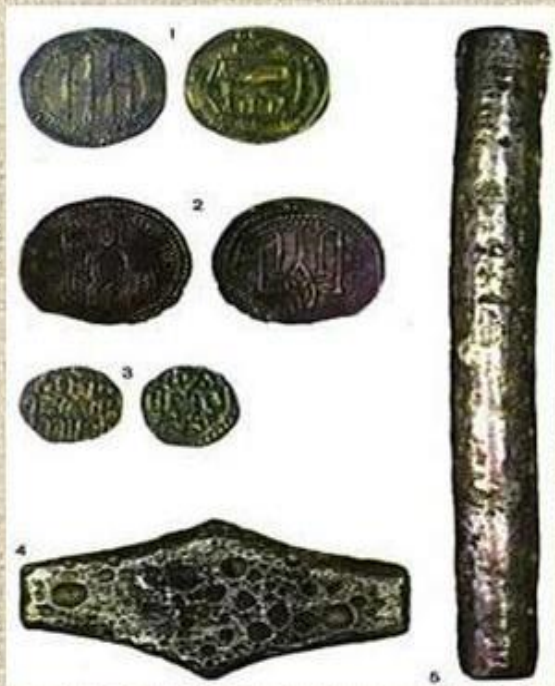
Рубль Полтина Дирхема