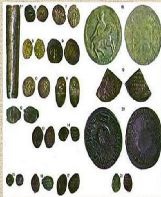
Деньга Пулы Копейка